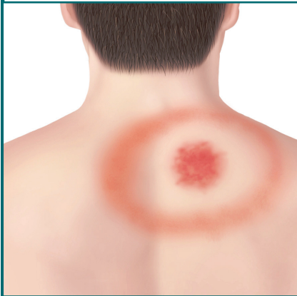
Sarpullido en forma de anillos